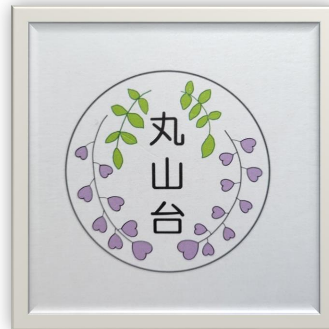
丸山台自治会のシンボルマーク