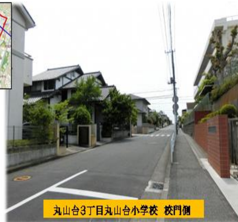
丸山台3丁目丸山台小学校 校門側